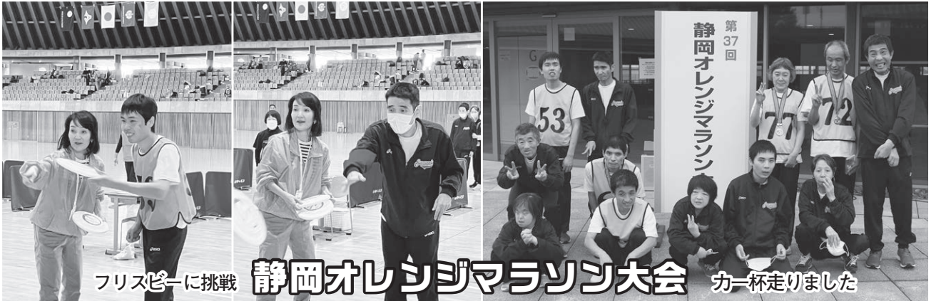
フリスビーに挑戦